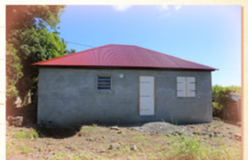
Version prêt à habiter de 54 250€ TTC